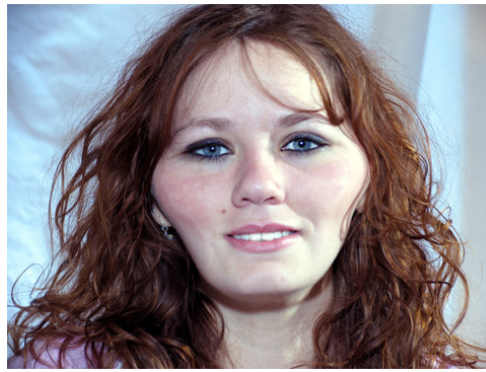
N°1 (en vert)